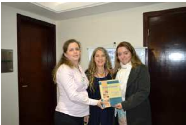
Representantes do CBOrt (Conselho Brasileiro de Ortopedistas)